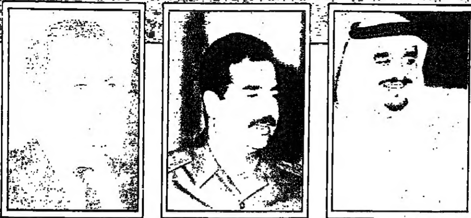
حسني مبارك صدام حسين خادم الحرمين الشريفين